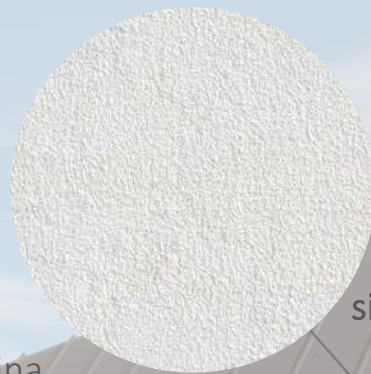
silikonová omítka světle šedá