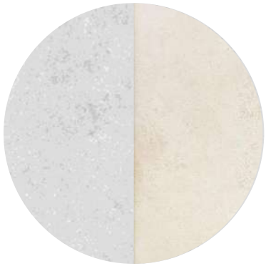
OBKLADY – béžová/šedá varianta výrobce Tubazin, OD1 mat, 60x30 cm