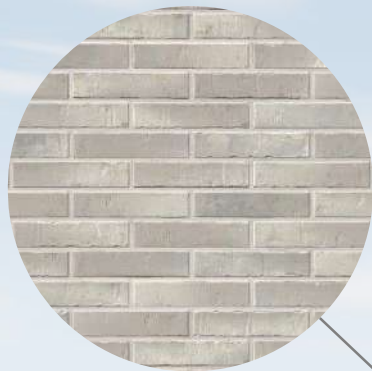
Obkladové cihlové pásy Klinker