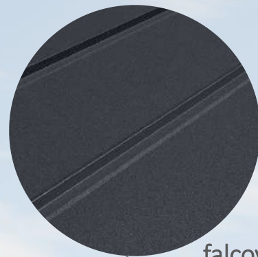
falcovaná střešní krytina antracitově šedá