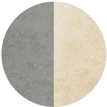
DLAŽBA – béžová/šedá varianta výrobce Tubazin, OD1 graphite mat, 60x60 cm